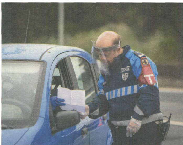
Regime actual vai muito mais longe do que permite o estado de calamidade

O art.º 19.º, n.º 1 da Constituição dispõe expressamente que "os órgãos de soberania não podem, conjunta ou separadamente, suspender o exercício dos direitos, liberdades e garantias, salvo em caso de estado de sítio ou de estado de emergência, declarados na forma prevista na Constituição". O que ocorreu às 00h00 do passado dia 3 de Maio foi que o país passou de um estado de emergência declarado constitucionalmente para um estado de emergência não declarado constitucionalmente. Tal significa que Portugal passou a viver num verdadeiro estado de calamidade constitucional.