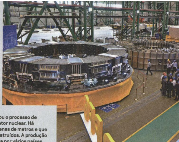
Em agosto arrancou o processo de montagem do reator nuclear. Há componentes com dezenas de metros e que nunca antes foram construídos. A produção está a ser assegurada por vários países