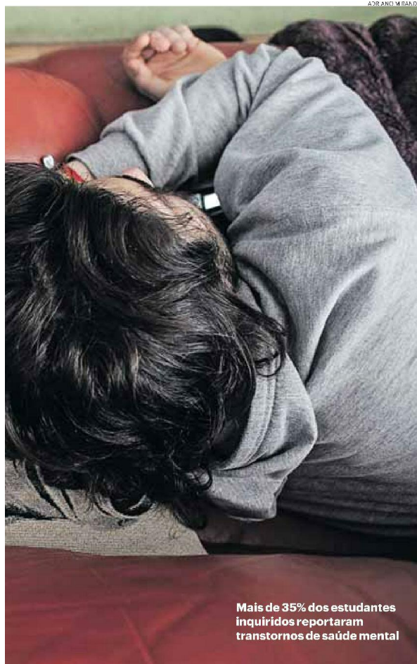
Mais de 35% dos estudantes inquiridos reportaram transtornos de saúde mental

der peso e 10,7% para ganhar peso. Mas a principal razão apresentada para este facto não são questões de saúde, mas antes estéticas, como admitiram 66,8% dos inquiridos.